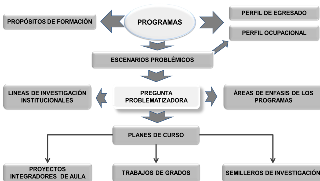
Figura 5-2. Estrategia para la implementación de pedagogías problémicas