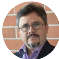
Elder Guerra Guatemala