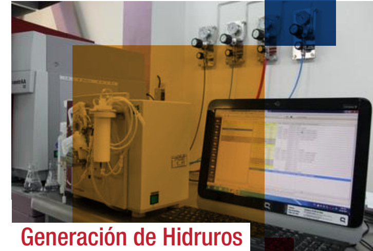
Generación de Hidruros