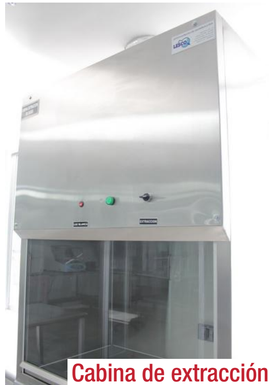
Cabina de extracción