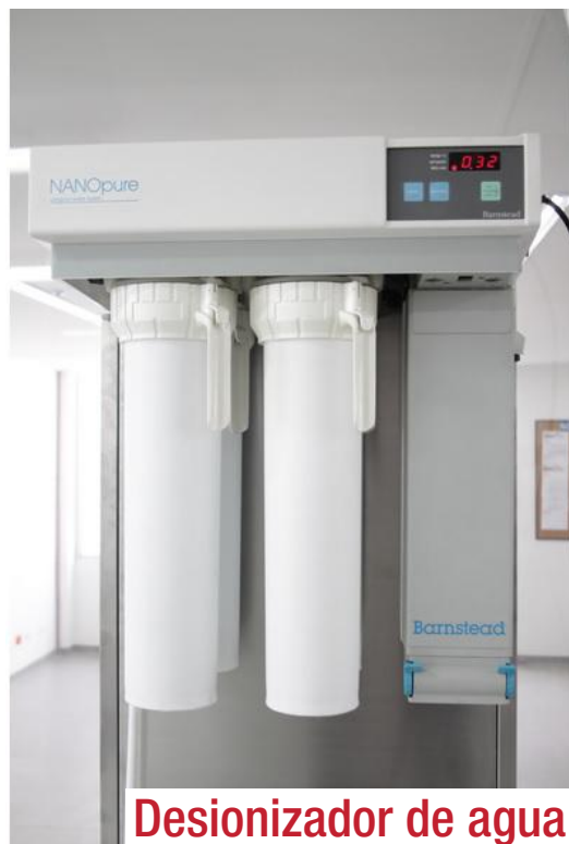
Desionizador de agua