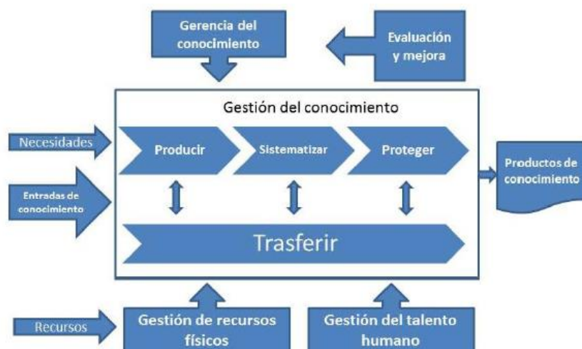
Figura 1. Sistema de Gestión

El modelo de gestión del conocimiento al interior de la Universidad aplica unos estándares de calidad y se resume en la siguiente figura: