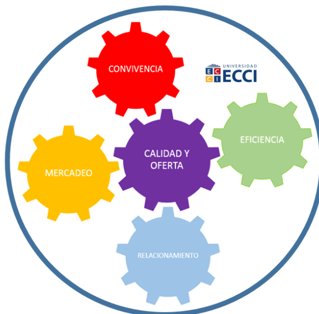
Figura 3. Objetivos estratégicos

El Plan de Desarrollo Institucional, se formula desde 5 objetivos estratégicos: Convivencia, eficiencia, calidad y oferta, relacionamiento y mercadeo, tal y como se muestra en la siguiente gráfica: